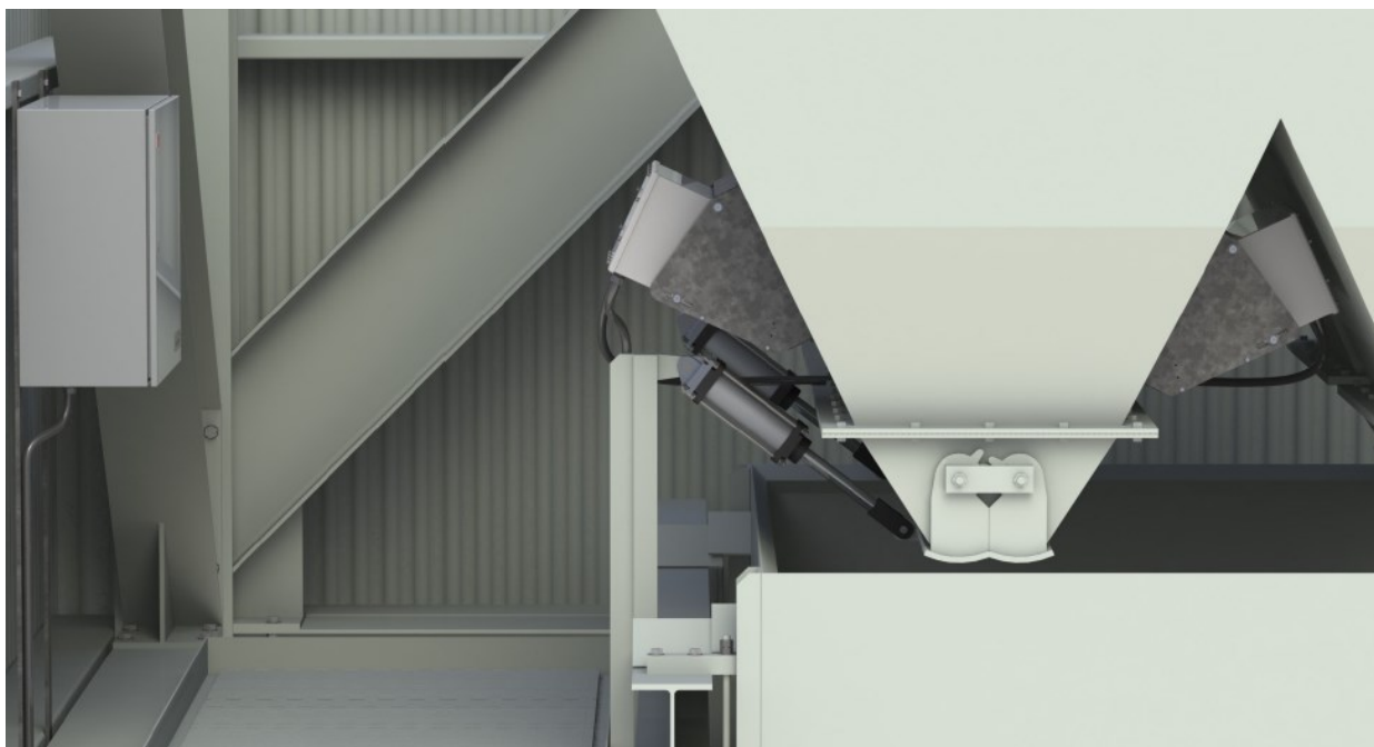
Рис. 2 Внешний вид анализатора ТВМ в бункерном исполнении

Модификация ТВМ 210 является базовой и предназначена для установки на конвейерной (поточной) линии, по которой происходит транспортировка сыпучего материала.